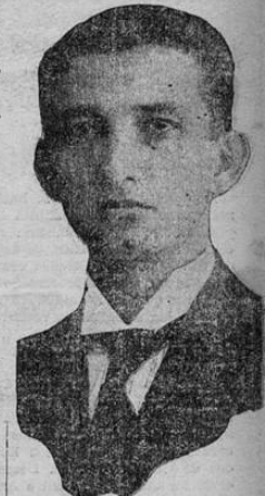
Lic. don LEON CORTES CASTRO, cuya renuncia aún está pendiente

Ahora bien, ese es otro aspecto que se le ve a los peligros de los proyectos de fomento en la cámara, pues se asegura que por muchas que sean las influencias de